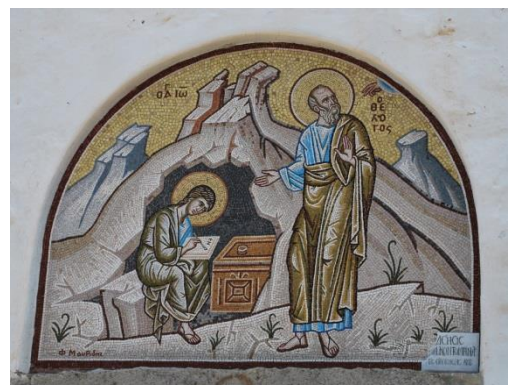
Über dem Eingang zur Höhle auf Patmos. Johannes diktiert SEINE Offenbarungen

Sie erhalten jede Woche ein Kapitel dieses Buches per Email zugesendet und sind eingeladen, die Texte und Übungen meditativ auf sich wirken zu lassen.